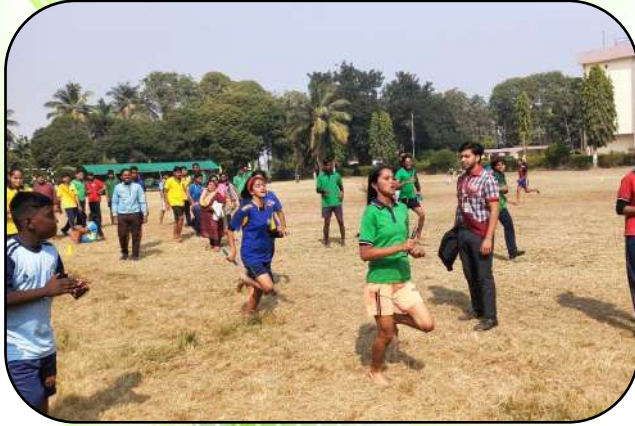
वार्षिक खेल दिवस (Annual sports day)