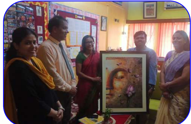
डीसी मैम का दौरा (DC Mam Visit)