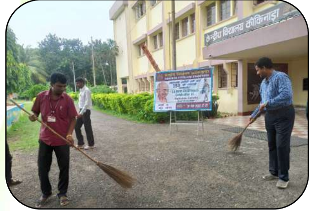
गांधी जयंती समारोह (Gandhi Jayanti)