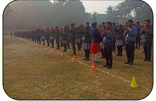
प्रातःकालीन सभा ( Morning Assembly)