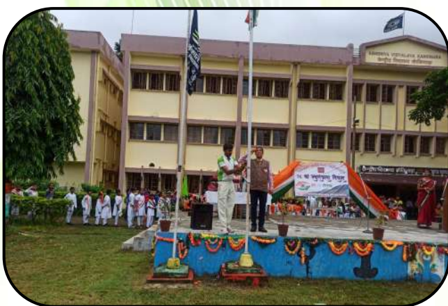
स्वतंत्रता दिवस (independence day)