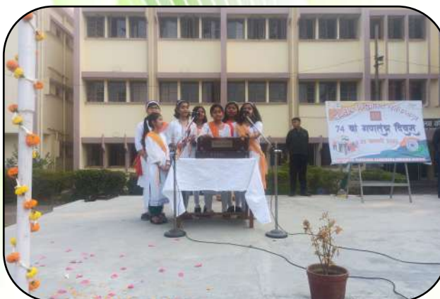
गणतन्त्र दिवस समारोह (Republic Day Celebration)