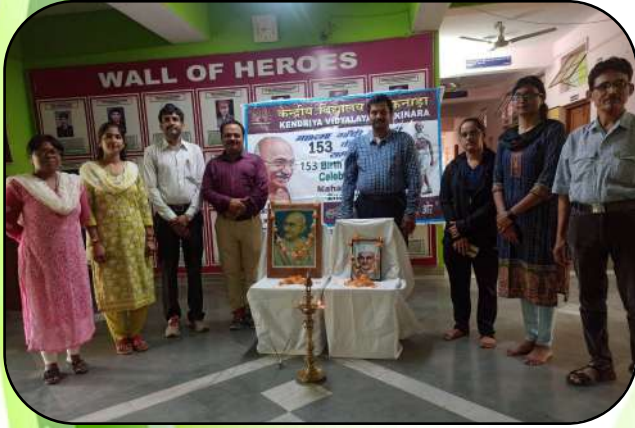
गांधी जयंती समारोह (Gandhi Jayanti)