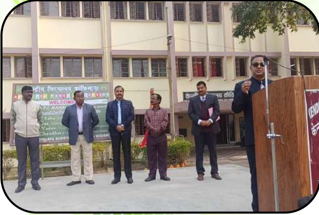
वार्षिक निरीक्षण ( Annual inspection)