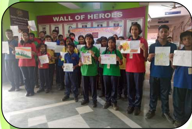
एक भारत श्रेष्ठ भारत (EBSB celebration)