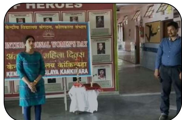
अंतर्राष्ट्रीय महिला दिवस (international women day)

मूर्खस्य पञ्च चिह्नानि गर्वो दुर्वचनं तथा।