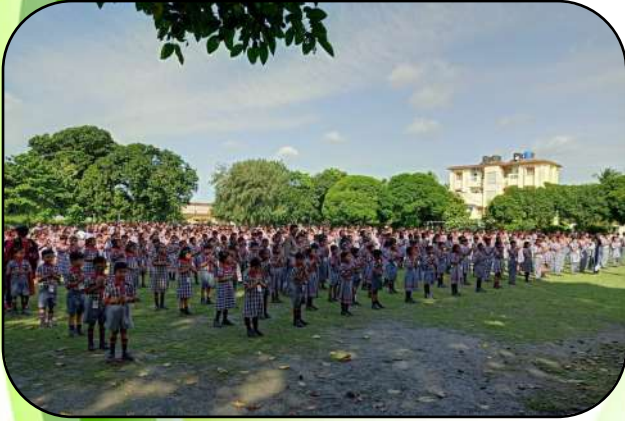
प्रातःकालीन सभा ( Morning Assembly)