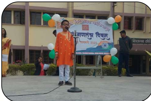
गणतन्त्र दिवस समारोह (Republic Day Celebration)