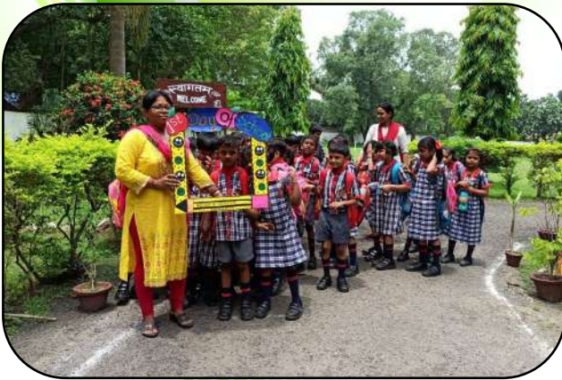
उन्मुखीकरण (Orientation programme)