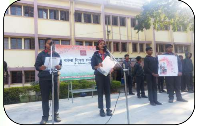
कालादिवस समारोह (Black day Celebration)