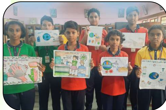
वैश्विक हाथ धुलाई दिवस (Global Hand washing Day)