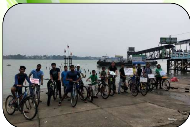
विश्व साइकिल दिवस (World Bicycle Day)