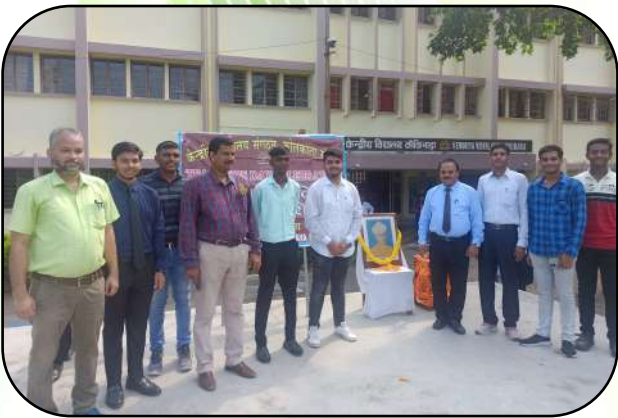
शिक्षक दिवस समारोह (Teacher's Day Celebration)