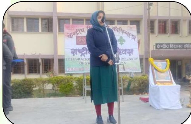
राष्ट्रीय युवा दिवस (National Youth Day)