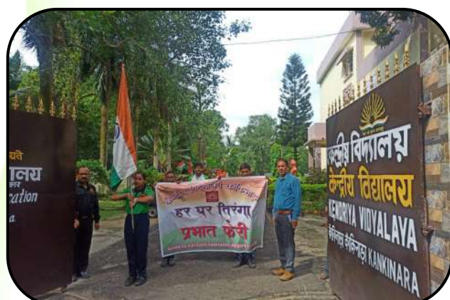
हर घर तिरंगा (Tricolour in every house)