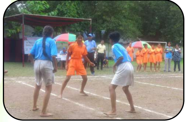
कब्बडी प्रतियोगिता (kabbadi competition)