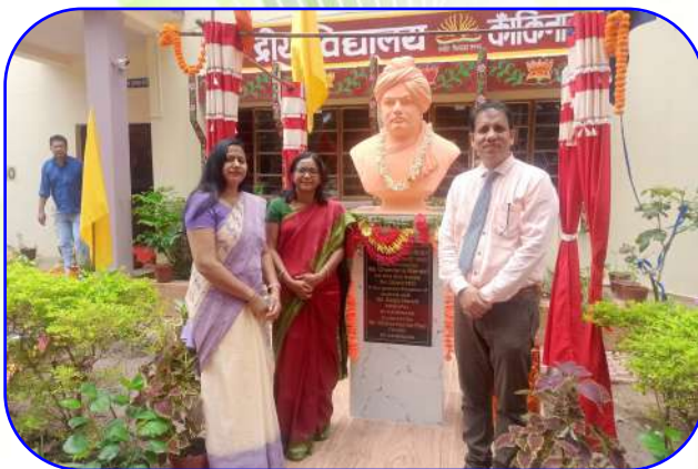
डीसी मैम का दौरा (DC Mam Visit)