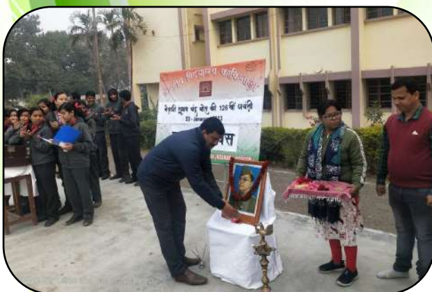
नेताजी जन्म दिवस (Netaji birthday Celebration)