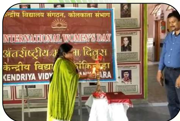
अंतर्राष्ट्रीय महिला दिवस (international women day)