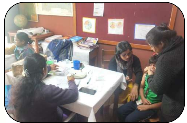
रूबेला टीकाकरण (Rubella vaccination)

आलस्यं हि मनुष्याणां शरीरस्थो महान् रिपुः । नास्त्युद्यमसमो बन्धुः कृत्वा यं नावसीदति ॥