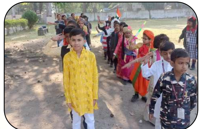
बाल दिवस समारोह (children's day celebration)

विद्यां ददाति विनयं विनयाद् याति पात्रताम्।