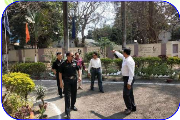
अध्यक्ष का दौरा (visit of Chairman)