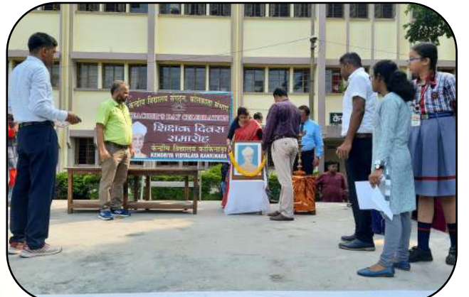
शिक्षक दिवस समारोह (Teacher's Day Celebration)