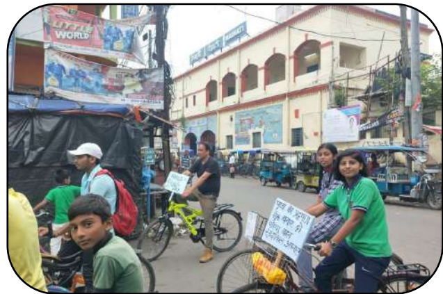
विश्व साइकिल दिवस (World Bicycle Day)