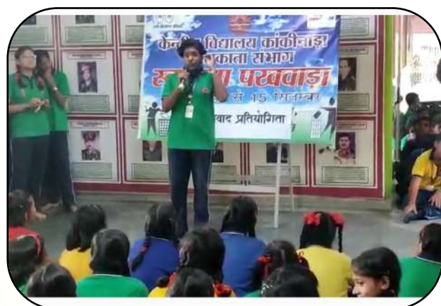
स्वच्छता पखवाड़ा (Cleanliness Programme)