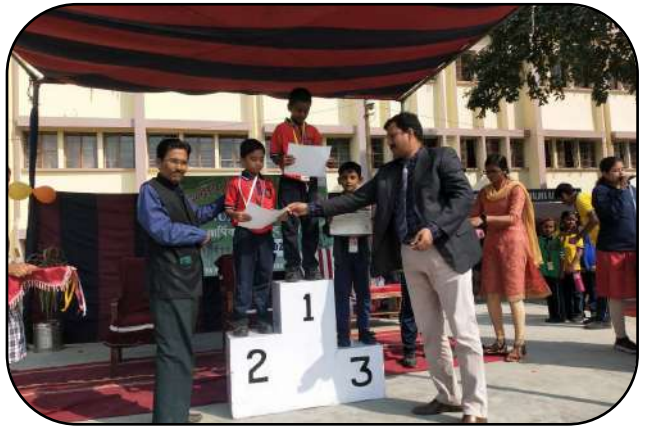
वार्षिक खेल दिवस (Annual sports day)