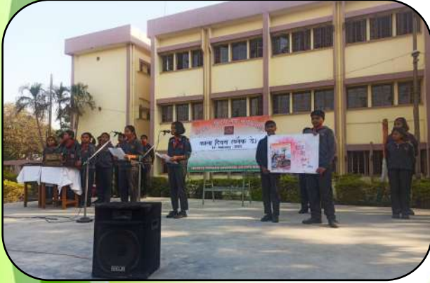
कालादिवस समारोह (Black day Celebration)