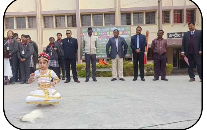
वार्षिक निरीक्षण ( Annual inspection)