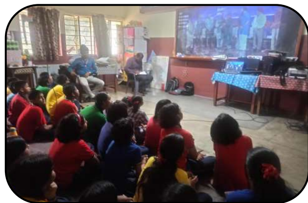
विश्वकर्मा दिवस (Vishwakarma Day)