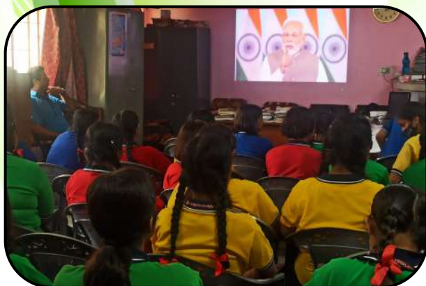
विश्वकर्मा दिवस (Vishwakarma Day)