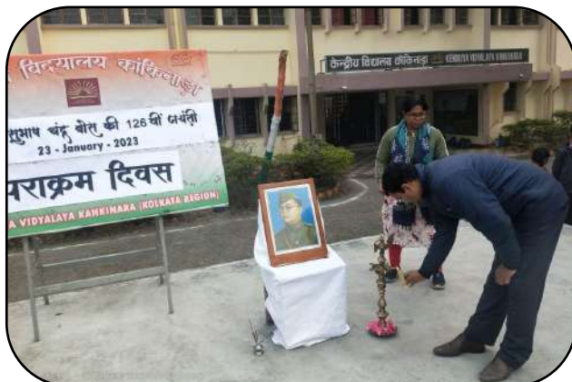
नेताजी जन्म दिवस (Netaji birthday Celebration)