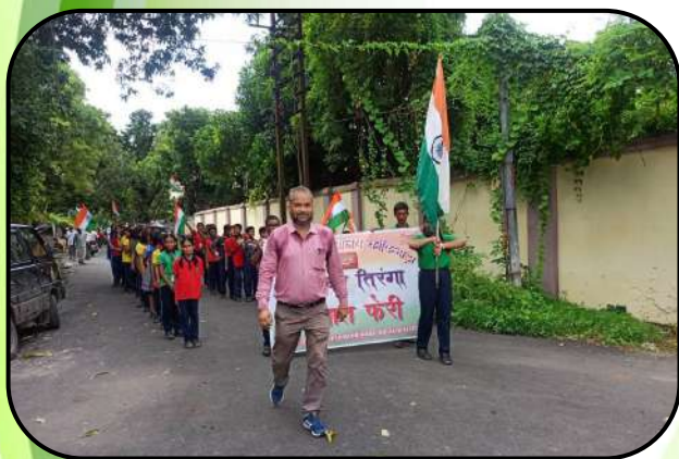
हर घर तिरंगा (Tricolour in every house)