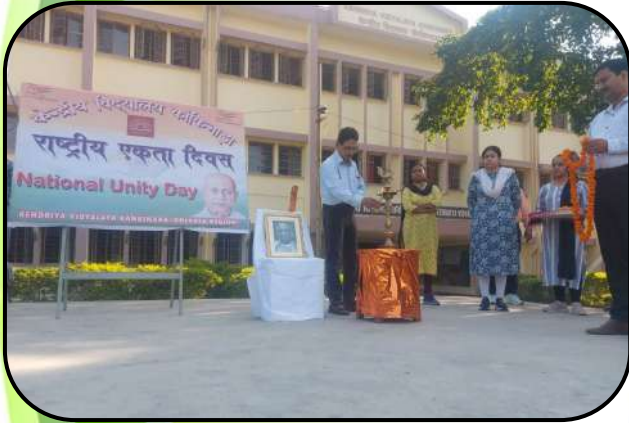
राष्ट्रीय एकता दिवस ( National unity Day)