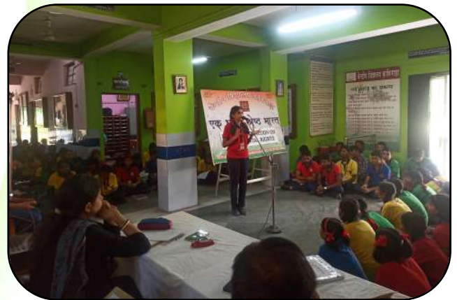
एक भारत श्रेष्ठ भारत (EBSB celebration)