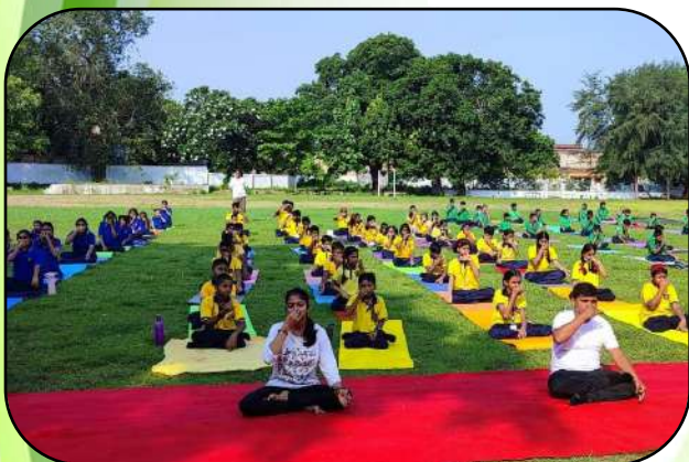
योग दिवस समारोह (Yoga day celebration)