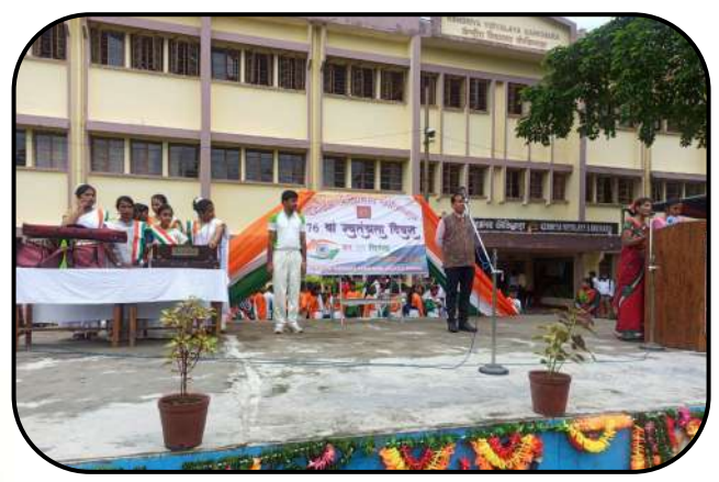
स्वतंत्रता दिवस (independence day)

क्रोधो हर्षश्च दर्पश्च हीः स्तम्भो मान्यमानिता।