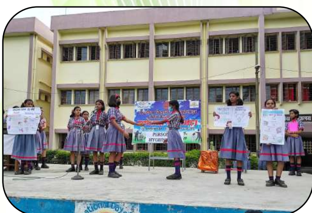
स्वच्छता पखवाड़ा (Cleanliness Programme)