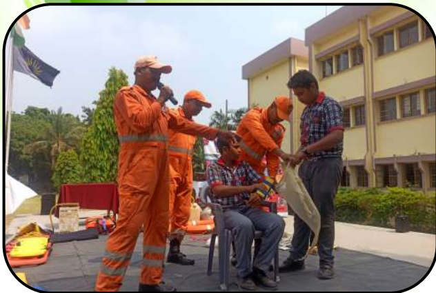
आपदा प्रबंधन प्रशिक्षण ( Disaster Management Training)