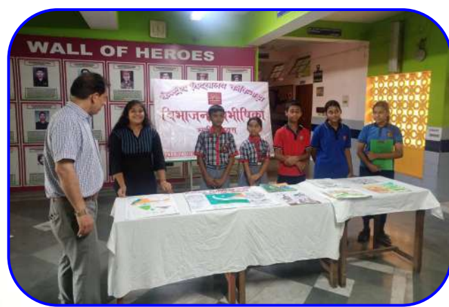
विभाजन विभीषिका स्मृति दिवस (Partition Horrors Remembrance Day)

जननी जन्मभूमिश्च स्वर्गादपि गरीयसी अर्थात : माँ और मातृभूमि स्वर्ग से भी बढ़कर हैं।