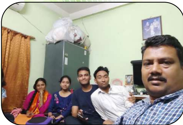
छात्रों के घर में शिक्षकों का दौरा (visit of teachers in students house)