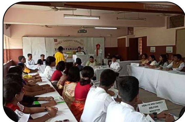
युवा संसद प्रतियोगिता (Youth Parliament Contest)