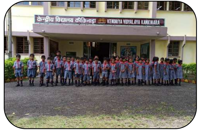
उन्मुखीकरण (Orientation programme)