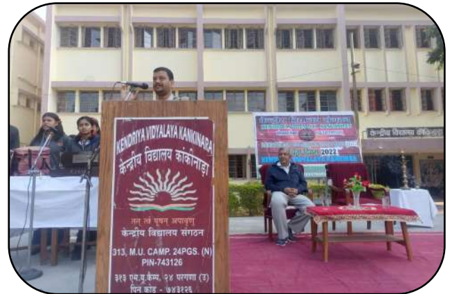
केवीएस स्थापना दिवस ( KVS Foundation Day)