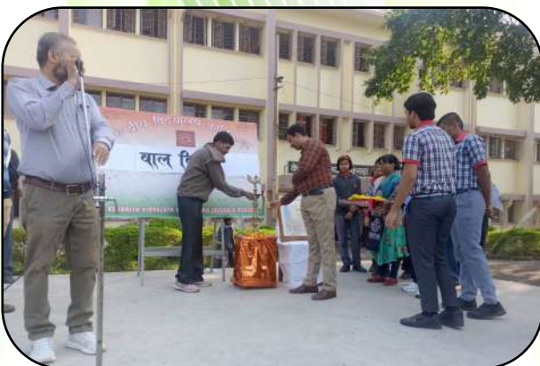
बाल दिवस समारोह (children's day celebration)