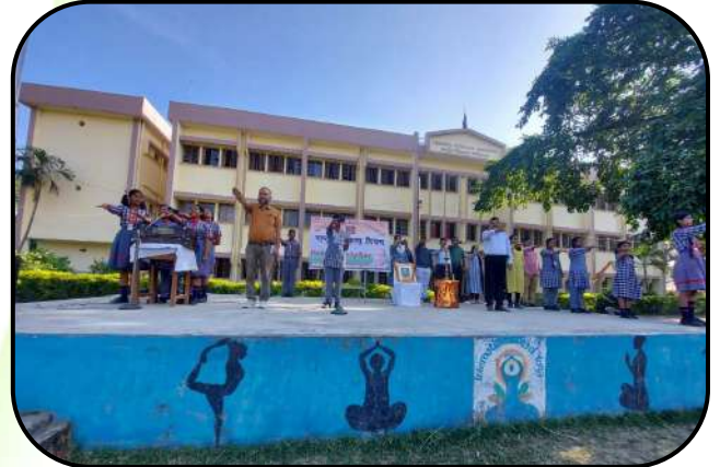
राष्ट्रीय एकता दिवस ( National unity Day)