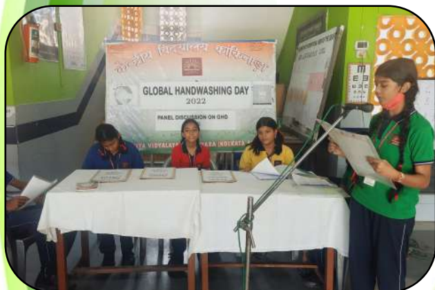
वैश्विक हाथ धुलाई दिवस (Global Hand washing Day)