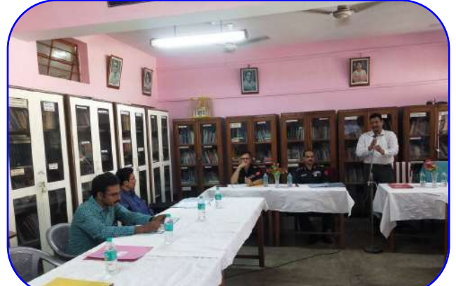
वीएमसी बैठक में अध्यक्ष (chairman in vmc meeting)