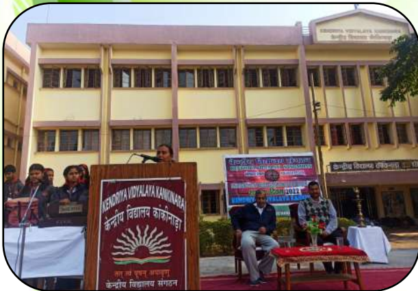
केवीएस स्थापना दिवस ( KVS Foundation Day)