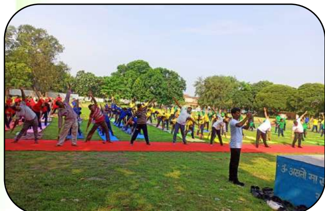
योग दिवस समारोह (Yoga day celebration)