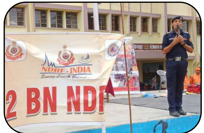
आपदा प्रबंधन प्रशिक्षण ( Disaster Management Training)