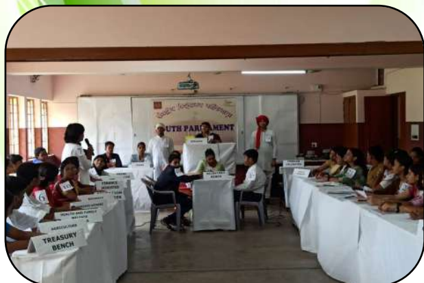
युवा संसद प्रतियोगिता (Youth Parliament Contest)