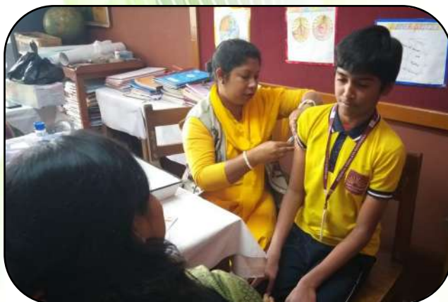
रूबेला टीकाकरण (Rubella vaccination)