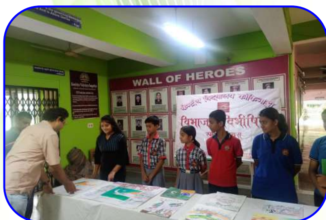
विभाजन विभीषिका स्मृति दिवस (Partition Horrors Remembrance Day)