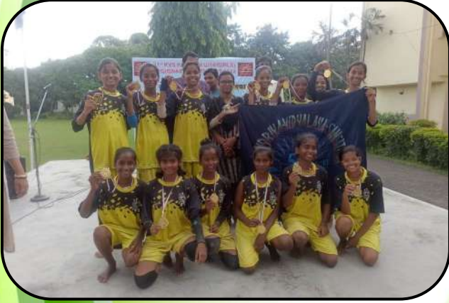
कब्बडी प्रतियोगिता (kabbadi competition)