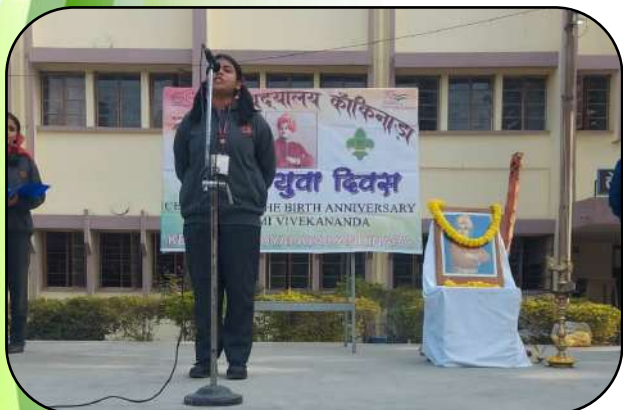
राष्ट्रीय युवा दिवस (National Youth Day)