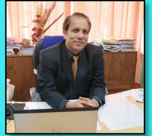
PRINCIPAL KV KANKINARA