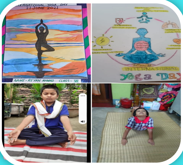
FITNESS IS THE WAY OF LIFE