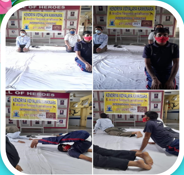
INTERNATIONAL YOGA DAY