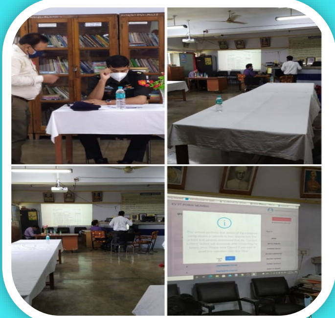
CLASS I ADMISSION LOTTERY

“We want deeper sincerity of motive, a greater courage in speech and earnestness in action.”