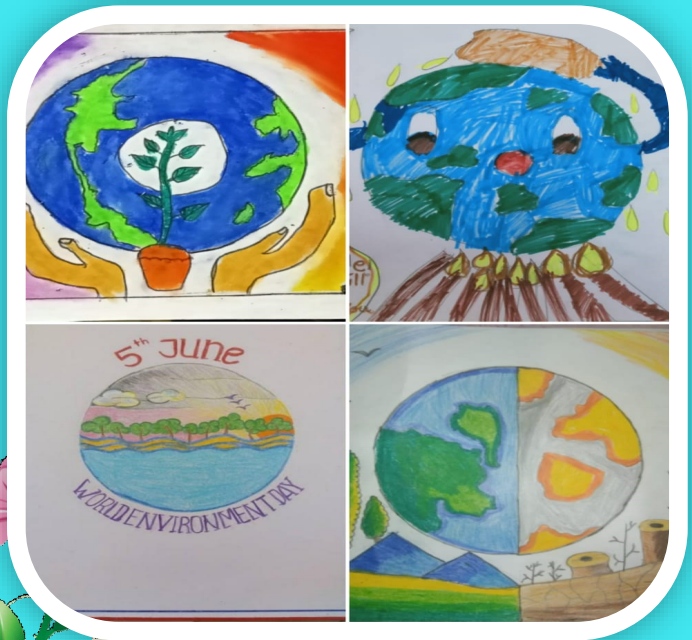
WORLD ENVIRONMENT DAY