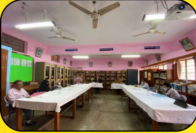
वी एम सी बैठक (VMC Meeting)