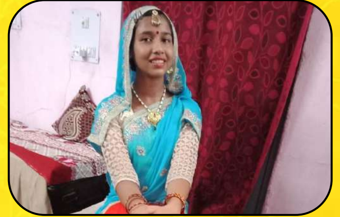
एक भारत श्रेष्ठ भारत (EBSB celebration)