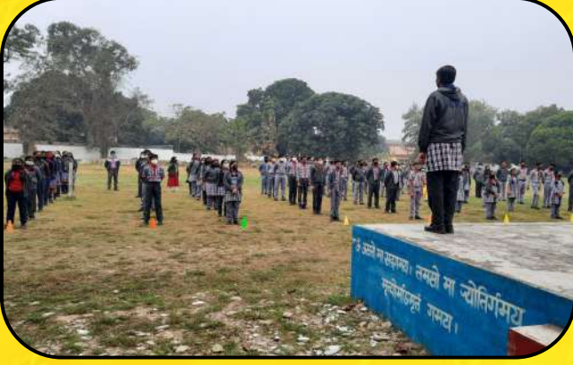
प्रातःकालीन सभा ( Morning Assembly)