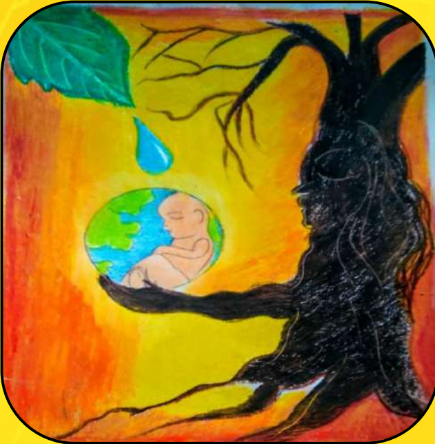
Pratyusha Basu, Class - VIII