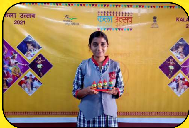
कला उत्सव (Art Festival ceremony)