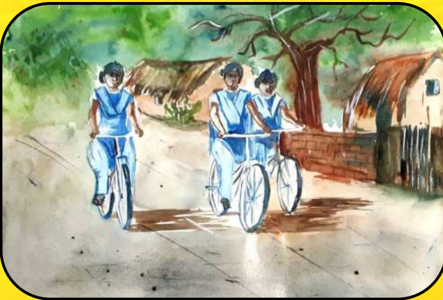
बालिका दिवस (Girls child Day)