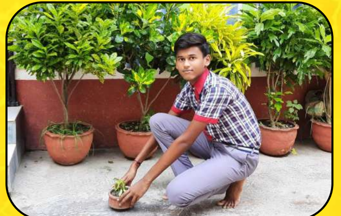
पर्यावरण दिवस समारोह (environmental day )