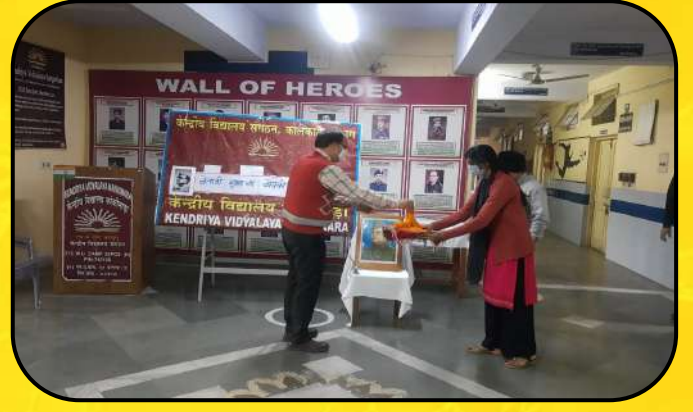
नेताजी जन्म दिवस (Netaji birthday Celebration)