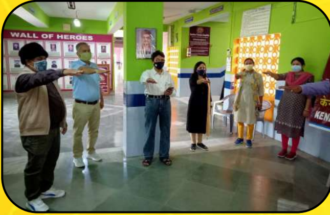
राष्ट्रीय एकता दिवस ( National unity Day)