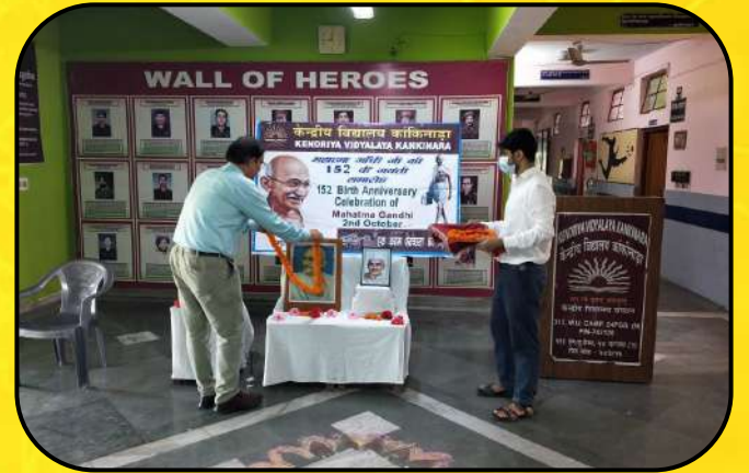
गांधी जयंती समारोह (Gandhi Jayanti)