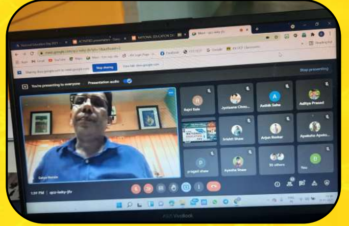
शिक्षक दिवस समारोह (Teacher's Day Celebration)