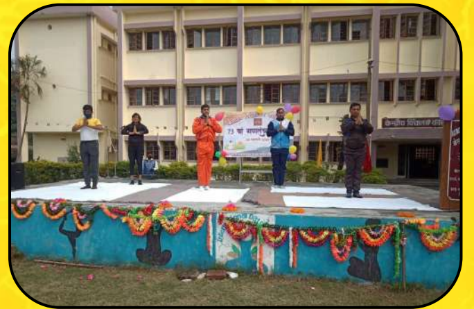
गणतन्त्र दिवस समारोह (Republic Day Celebration)