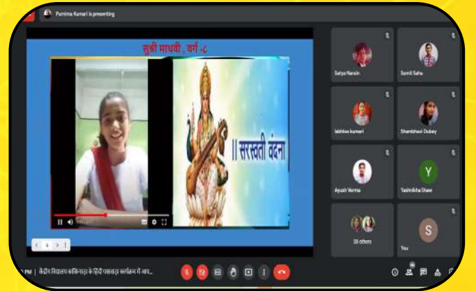
हिन्दी पखवाड़ा (Hindi Pakhwara)