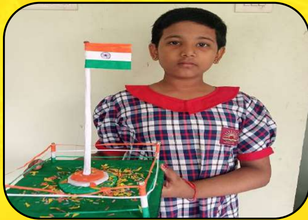
गणतन्त्र दिवस समारोह (Republic Day Celebration)