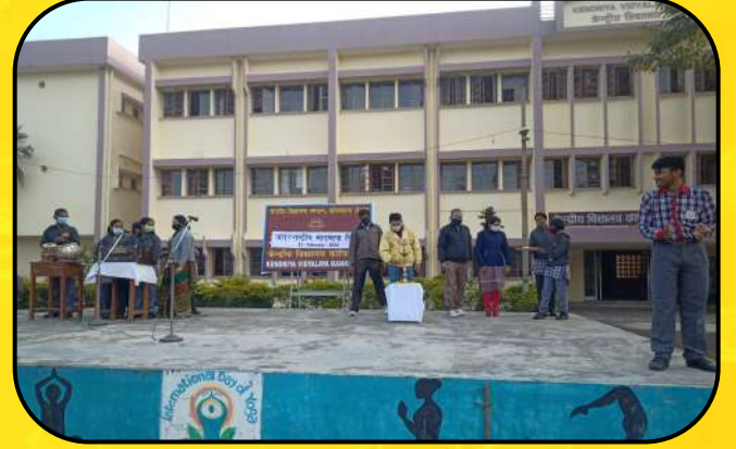
अंतर्राष्ट्रीय मातृभाषा दिवस (international mother tongue day)