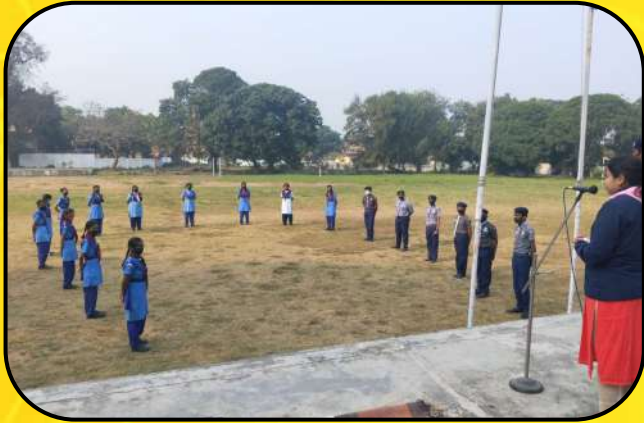
विश्व चिंतन दिवस (World Thinking Day)