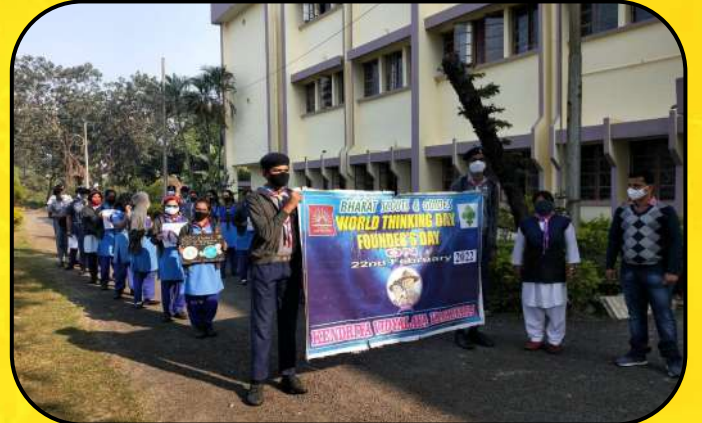
विश्व चिंतन दिवस (World Thinking Day)