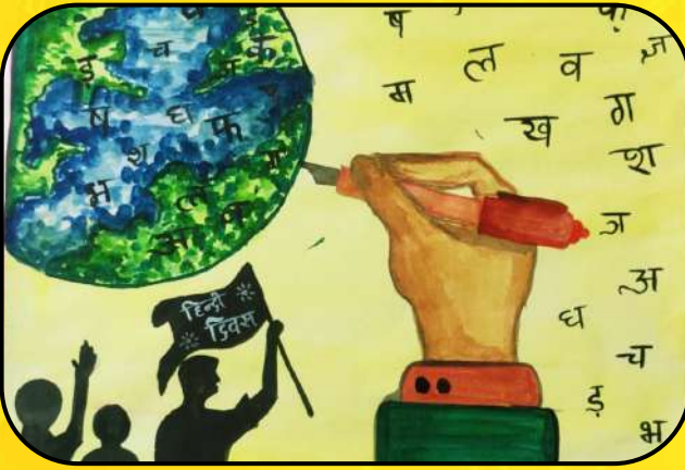
Ashwick Shaw, Class - III