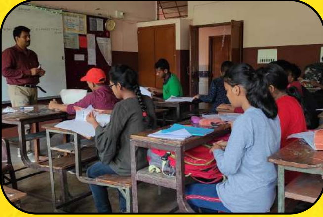
सुधारात्मक शिक्षण (Remedial Class)