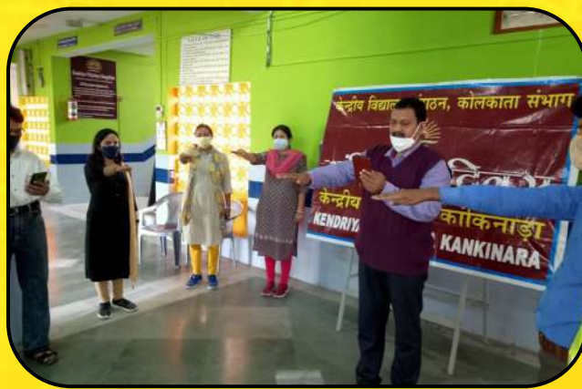
संविधान दिवस समारोह (Constitution Day Celebration)