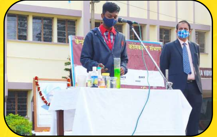
विज्ञान दिवस समारोह (Science Day Celebration)