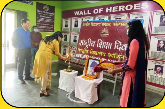
शिक्षक दिवस समारोह (Teacher's Day Celebration)