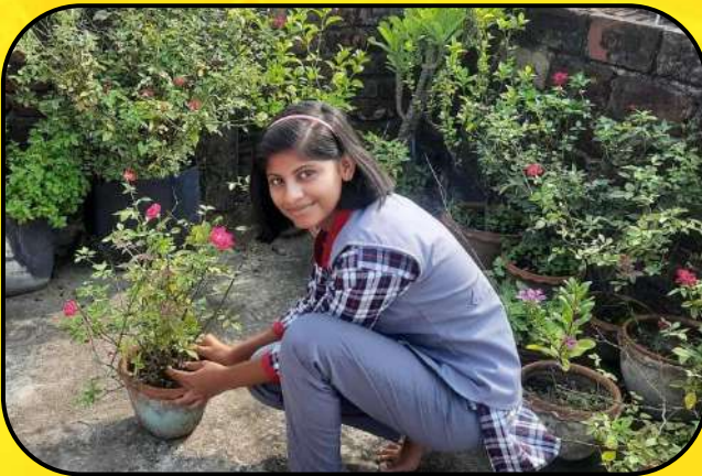
पर्यावरण दिवस समारोह (environmental day)