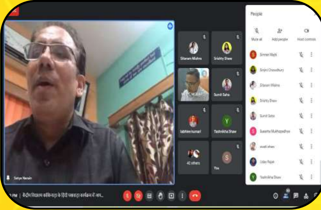
हिन्दी पखवाड़ा (Hindi Pakhwara)