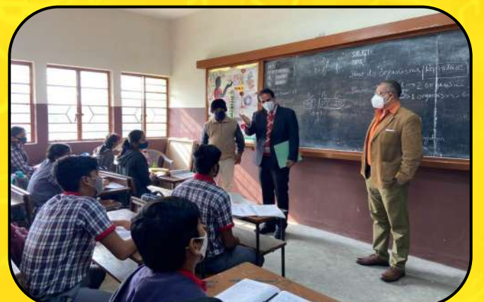
अध्यक्ष का दौरा (Visit of Chairman)