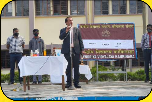
विज्ञान दिवस समारोह (Science Day Celebration)