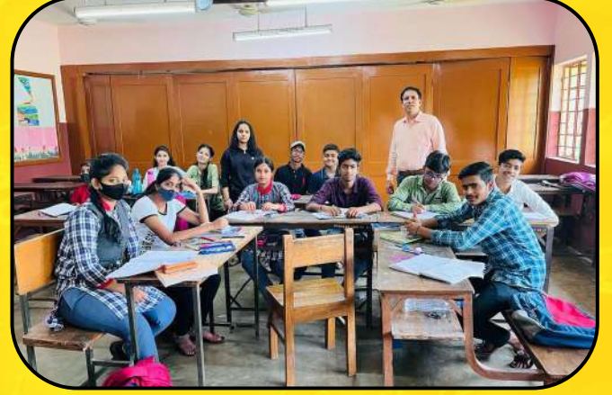
सुधारात्मक शिक्षण (Remedial Class)