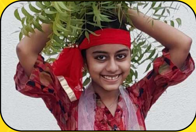
एक भारत श्रेष्ठ भारत (EBSB celebration)