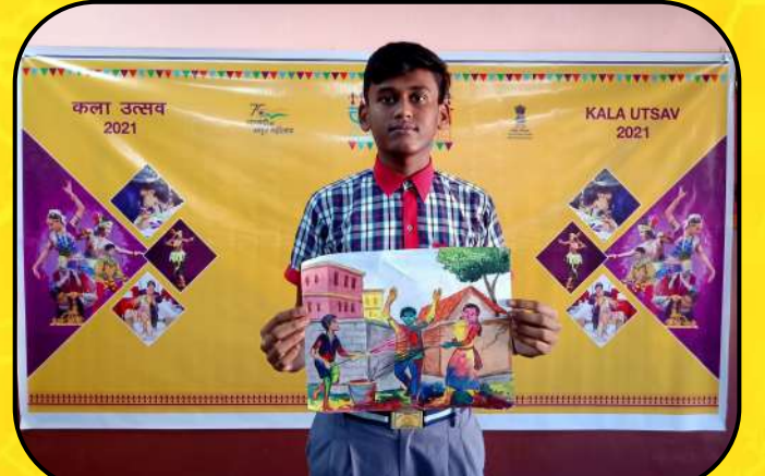
कला उत्सव (Art Festival ceremony)