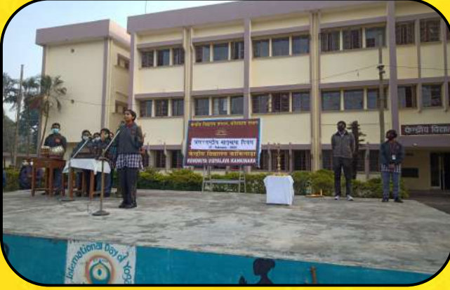
अंतर्राष्ट्रीय मातृभाषा दिवस (international mother tongue day)