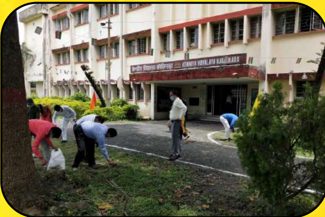
स्वच्छता अभियान (Cleanliness Programme)