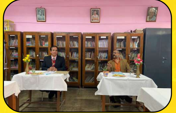
वी एम सी बैठक (VMC Meeting)