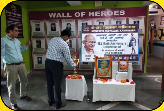
गांधी जयंती समारोह (Gandhi Jayanti)