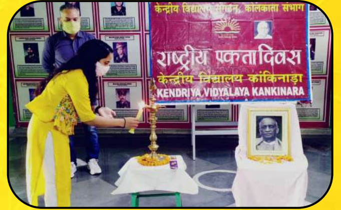
राष्ट्रीय एकता दिवस ( National unity Day)