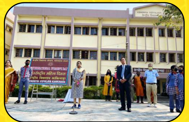
महिला दिवस (women's day)