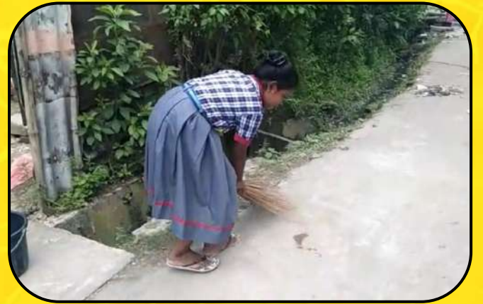
स्वच्छता अभियान (Cleanliness Programme)